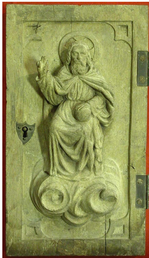
La porte du tabernacle (musée de Maule)

Nous savons que deux des trois cloches de l'église furent déposées en octobre 1793. Sans doute furent-elles fondues pour permettre de battre monnaie ou couler des fûts de canon pour défendre la patrie en danger.